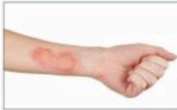
سوختگی درجه ۲