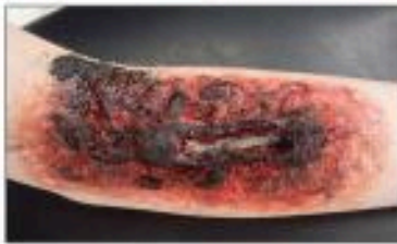
سوختگی درجه ۳