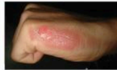
سوختگی درجه ۱